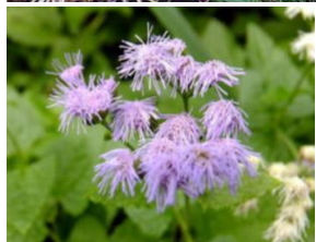
フジバカマ (ヒヨドリバナ)