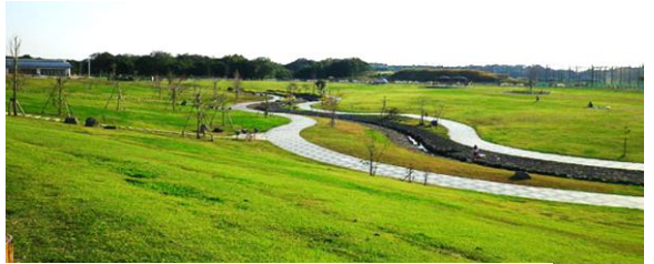
↑ゆとりの森の修景池ゾーン(調整池)と上空