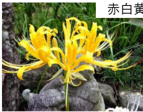
赤白黄ヒガンバナ