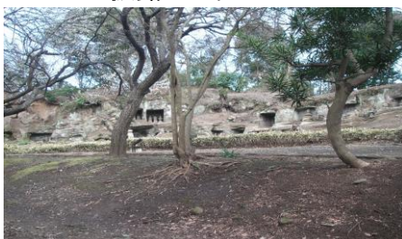
まんだら堂やぐら群