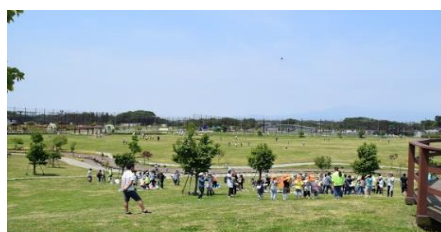
整備中で森ではないゆとりの森