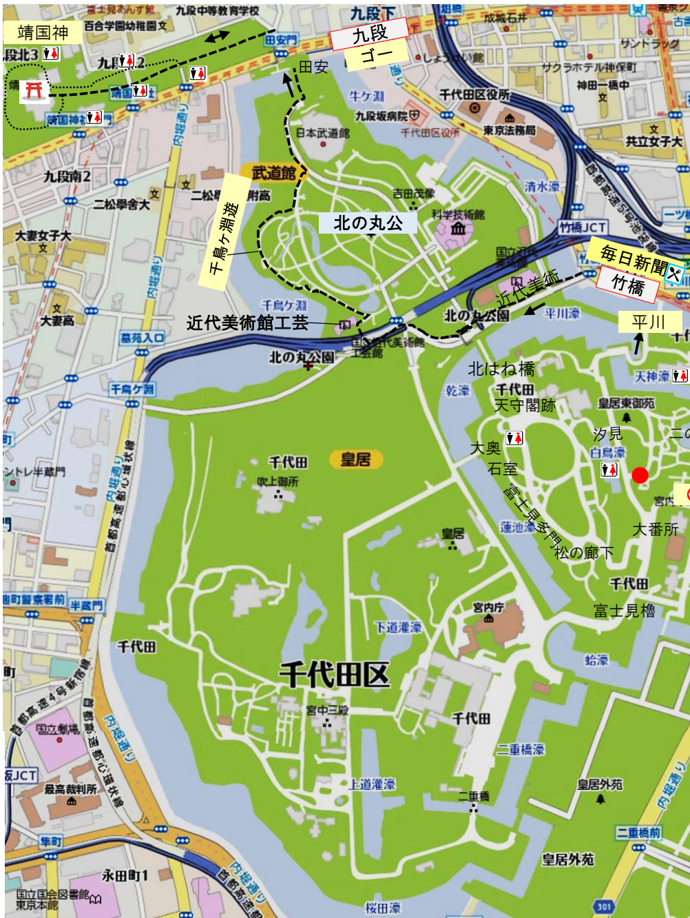
東御苑～北の丸公園マップ (マピオン地 図)