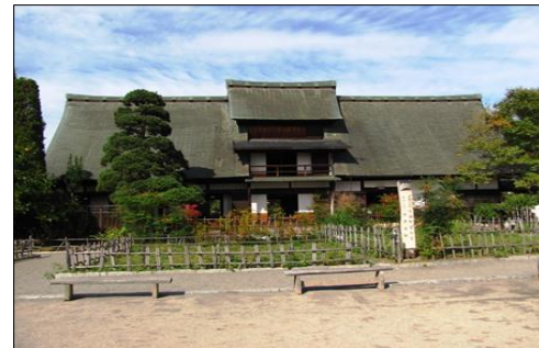
甘草屋敷(旧高野家住宅)