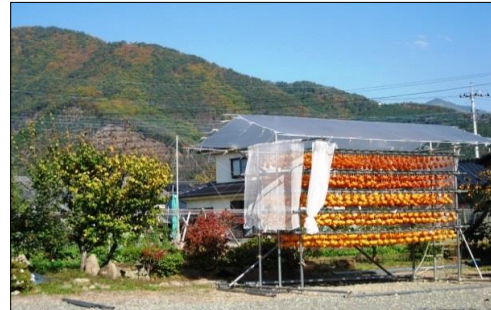
ころ柿の里散策(石原様撮影)