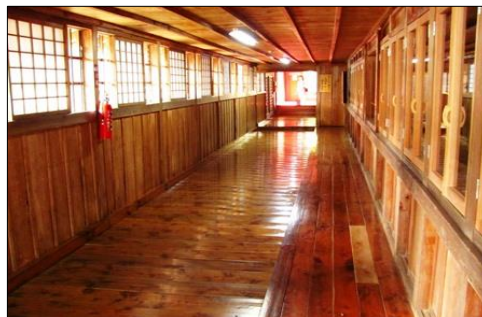
恵林寺のうぐいす廊下