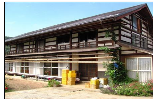
岩波農園:ころ柿が吊るされる予定